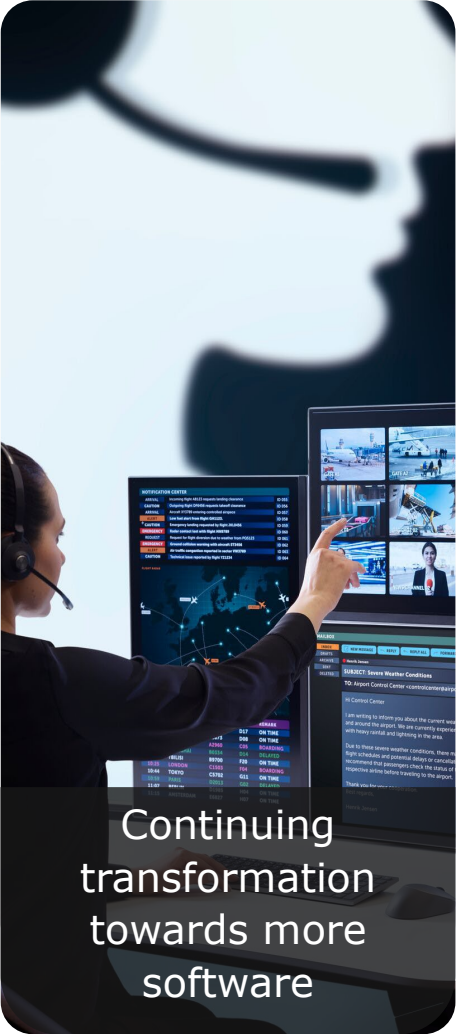
Continuing transformation towards more software