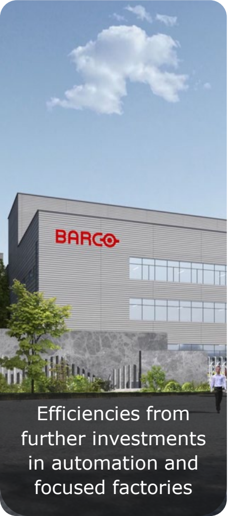
Efficiencies from further investments in automation and focused factories