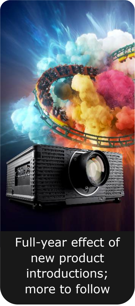
Full-year effect of new product introductions; more to follow