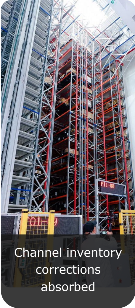
Channel inventory corrections absorbed